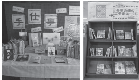
どちらのコーナーもお気軽にご覧ください