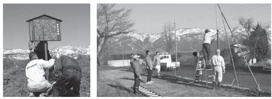
文化財の看板立て、瑞穂グラウンドのネット貼りが行われました。

瑞穂 ◆瑞穂グラウンド整備 4月13日、瑞穂グラウンドのネット張り、冬囲いはずし