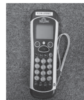
蔵書点検で使用する ハンディーターミナル

現在、市立飯山図書館には約12万3千もの資料が所蔵されており、それらの資料を毎日たくさんの市民の方にご利用いただいております。引き続き、市民の皆さまが必要とする資料を正しく提供できるよう、実際に書架に並んでいる資料と所蔵データを突き合わせ、間違った書架にある資料を元の位置に戻したり、行方不明になっている資料はないか等、職員全員で点検作業を行います。