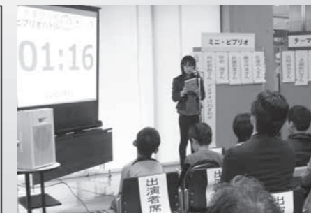
昨年10月開催のミニビブリオバトルの様子

【ミニビブリオバトル開催概要】 日時 8月4日(日) 13:00～ 場所 図書館3階 多目的室 募集人数 10名程度 参加料 無料 申込方法 学校を通じて配付されるチラシの申込用紙又は電話にて図書館へ申し込んでください。 申込締切 7月12日(金) 問合せ先 市立飯山図書館 ※申し込みをされた方には、後日詳細の連絡通知をお送りします。