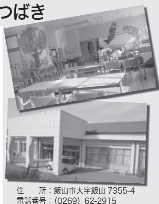
住所：飯山市大字飯山 7355-4 電話番号：(0269) 62-2915

苑長に聞いてみた!! Q. デイサービスセンターゆきつばきってどんなところ? A. デイサービスセンターゆきつばきは定員30名で、職員は介護士、看護師合わせて15名です。その他に厨房も備えており、手作りのあたたかい食事をその場で提供することができます。個別にその方のできることで興味に合わせて無理せず楽しく過ごすことができるデイサービスです。 Q. 一押しポイントは? A. 施設内は、季節感をとても大切にしており、利用者の皆さまと一緒に作った四季折々の花や風景をモチーフとした作品を部屋の折々に賑やかに飾っています。 Q. 最後に一言お願いします! A. 「今日もたくさん笑った。楽しかった」と言っていたできるように居心地のよい場所と笑顔のサービスで皆さまをお待ちしております。