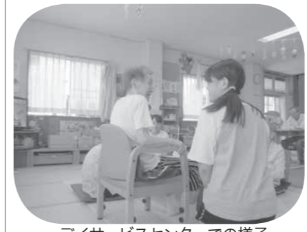
デイサービスセンターでの様子

「ボランティア活動に関心はあるけれど参加のきっかけがつかめない」そんな方へ、飯山市社会福祉協議会では、夏休み期間中に参加できる福祉体験のボランティアを募集しています。福祉施設の利用者とのふれあいや仕事の体験を行います。ませんか?ぜひご参加ください。