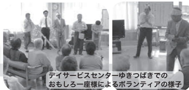
デイサービスセンターゆきつばきでのおもしろ一座様によるボランティアの様子