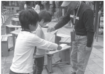
子どもたちによる街頭募金