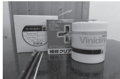
▲本の修理専用のテープ・接着剤

① 図書館資料の撮影・複写 Q・図書館の本は写真撮影できますか? A・図書館の本や資料の撮影は、著作権法により禁止されています。個人の調査研究のために資料の写しが必要な場合は、カウンターで申し込んでください。職員が資料のコピーを行います。(有料) また、複写が認められるのは、著作物全体の半分以下とされています。また、最新号の雑誌や当日の新聞の複写はできません。詳しくはカウンターでご相談ください。 ② 図書館の本が破れたとき Q・図書館で借りた本のページが破れた場合、セロハンテープで直して良いですか? A・セロハンテープ等での応急処置は行わないでください。セロハンテープは時間が経つと変質するため、本の修理には向いていません。図書館では専用のテープで修理していますので、そのままの状態でお持ちください。