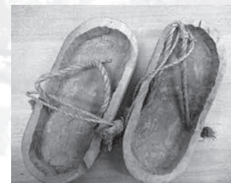
ヤチゲタ (飯山市ふるさと館蔵)

田んぼや沼など、ぬかるんだ場所に入る時に履いた。全国的には広い板状の田下駄が一般的に使われていたため、木をくり抜いて用いた本品は珍しい例といえる。大倉崎にお住まいの方からご寄贈いただいたもの。