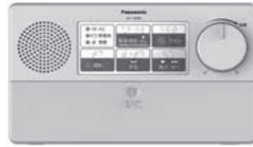
▲新しい戸別受信機

※転出等により、戸別受信機が不要になった場合には、返却をお願いします。詳しくはお問い合わせください。