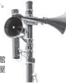
飯山市公民館に設置された屋外スピーカー

各地区活性化センター、市役所、斑尾中継局（山の家）の計12カ所に設置しました屋外スピーカーの試験放送を新型コロナウイルス感染症の感染が収束し次第行いますのでご承知ください。