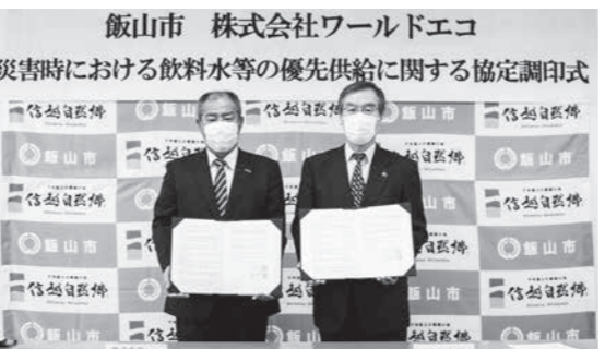
左から(株)ワールドエコ福原初代表取締役、足立市長

足立市長は、「近年、土砂災害、風水害等が頻発している。市でもペットボトルを備蓄しているが、不測の事態が考えられる。水は、人間が生きていくうえで必要なもの。この協定により、被災者のもとに迅速に水の提供が可能となり心強い。」と協定にあたりあいさつしました。