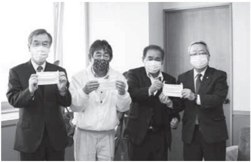
左から 足立市長、内河取締役、山岸相談役、長瀬教育長