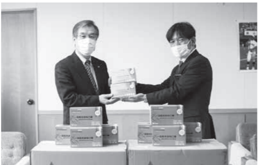
左から 足立市長、勝山常務取締役