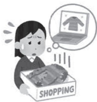
▲注文の際は十分注意しましょう

文は、トラブルがあった際の問い合わせが難しいことから注意しましょう。通信販売では、実物を確認することができません。注文する前に商品の詳細をよく確認し、慎重に判断しましょう。 また、通信販売にはクーリングオフ制度がありません。返品はショッピングで決められたルールに従って行うことになるので、返品に関する特約を確認しましょう。「サイズが違った」「イメージと違う」「気に入らなかった」などの理由でも返品できるか、返品の際の送料負担の有無、などを確認しておきましょう。 あわせて、注文の内容に関する確認画面やメールは必ず保存しておき、商品が届いたらすぐに中身をチェックして、注文と違ったり壊れたりしている場合は、すぐにショッピングに連絡しましょう。