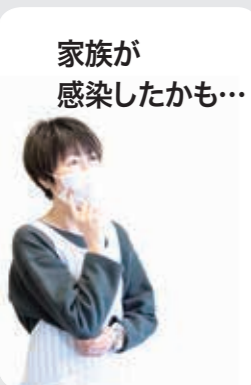
家族が 感染したかも…