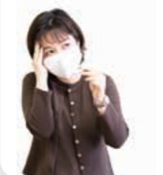
熱や咳がある… どうしたら？