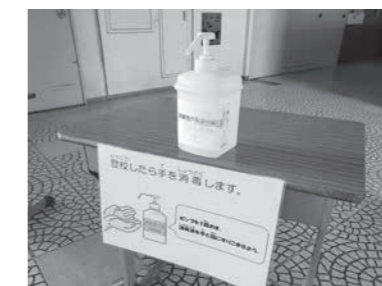
昇降口・教室などにアルコール消毒を配備し登下校時、休み時間等こまめに消毒。

新年度が始まったばかりの時期での休校となり、児童生徒の皆さん、保護者の皆さんには大きなご心配をおかけしましたが、臨時休校中は各担任の先生方から課題が進められ、家庭学習により学習が進められました。今後も行事の見直し、長期休暇の短縮なども行いながら授業時間を確保していく予定です。 感染防止しながら マスク着用のほか、学校では