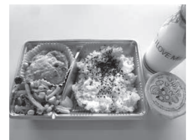
配膳時の感染防止のため再開後も5月中は全小中学校で弁当形式で給食を提供。