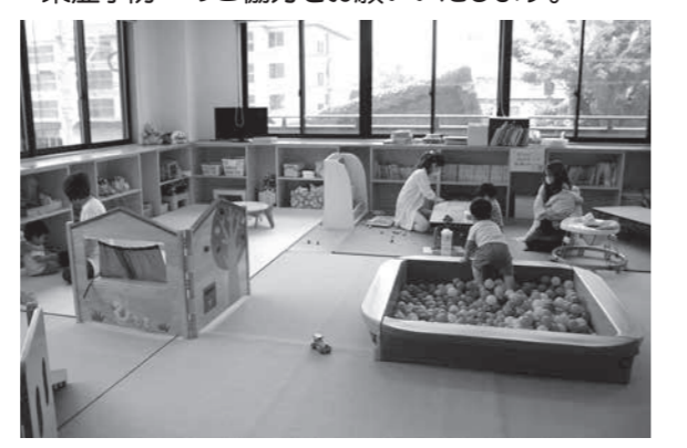
再開後の子育て支援センター「たんぼぼ」の様子