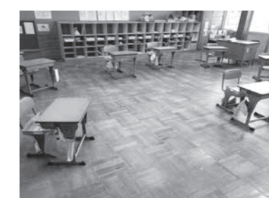
教室の机などは通常以上に距離をとり、密にならないよう配置。