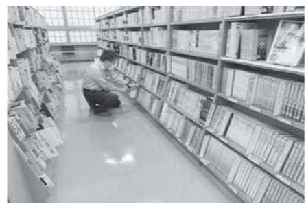
▲端末にて本のデータを読み込む作業の様子

【休止のお知らせ】 6月開催の「絵本とわらべうたの会」および「おはなしひろば」は、新型コロナウイルス感染症拡大防止対策により休止とさせていただきます。ご了承ください。