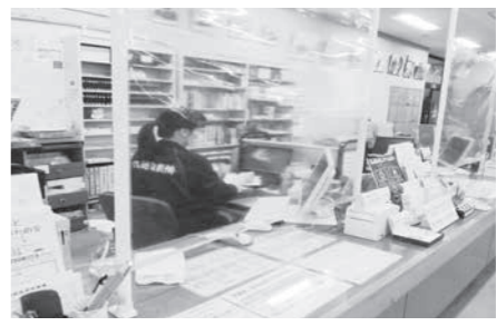
▲カウンターに設置した飛沫感染防止シート

新型コロナウイルス感染拡大防止対策として、カウンターに飛沫感染防止シートを設置いたしました。 引き続き、館内の除菌やこまめな換気を行っておりますが、ご来館いただく際はマスクの着用、手洗いうがいなどの対策を取っていただきますよう、ご理解とご協力をお願いいたします。