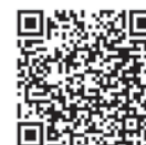
QRコードでホームページをチェック!

飯山市では、新型コロナウイルス感染防止対策を図るため、市内の飲食、宿泊、小売事業者等が、自らの店舗等で行う感染予防対策に係る経費を支援します。4/1以降に対策を実施された方も対象となります。詳しくは、お問い合わせください。