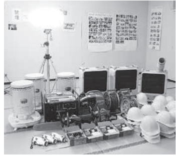
ストーブ、無線、発電機等

ツキノワグマの出没に注意してください 農林課 耕地林務係 ☎内線 2666 本年度もクマの目撃情報が多く寄せられています。子グマを見かけると、必ず親グマが近くにいます。不用意に近づくと大変危険です。クマは人里近くでは主に夜間に活動していますが、山中では昼夜を問わず活動し、特に朝夕の薄暗い時間帯に盛んに活動しています。最近是人里の近くでも日中の出没が目撃されています。 クマに会わないために、田畑や山林に行く方、山菜やキノコ採りで山に入る方は、必ずラジオや鈴など、音の出るものを携帯し、クマに自分の存在を知らせましょう。クマは市内のどこにでも出る可能性があります。通勤、通学時にも注意してください。