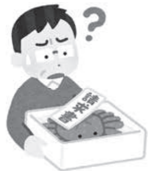
▲一方的な送り付けは支払不要です

る、いわゆる「送り付け商法」です。被害の事例では、健康食品や海産物等が挙げられます。新型コロナウイルス感染症の拡大に便乗してマスクを送り付ける事例も県内で発生しています。 注文した覚えのないが届いた場合は本当に注文していないか、家族に注文した人がいないかを確認しましょう。代金引換で届いた場合、支払ってしまつたと返金交渉は困難なため、受取保留にしましょう。誰も注文していないければ送り付け商法の可能性があります。使用せず、そのまま保管しておきましょう。特定商取引法の規定により、14日間が経過したときは自由に処分することが出来ます。業者に連絡して引き取りを依頼することにより保管期間を7日間に短縮することも出来ます。保管期間経過後に業者からの連絡があった場合は、「保管期間が経過したので処分した。」とだけ答え、代金の請求や商品の引き取りに応じる必要はありません。