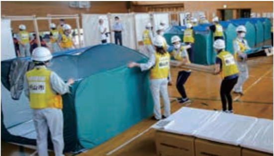
今回導入したパーティション(左手前)

また、新型コロナウイルス感染症に対応するため整備したサーマルカメラや飛沫感染を防ぐためのパーティションの設置などを含めた、避難所の運営方法を確認しました。このほか、避難所のニーズと必要な物資の発注、物資到着状況の確認を一元的に管理し、国・県・市で共有する物資調達・輸送調整等支援システムによる支援物資要請の訓練を行いました。