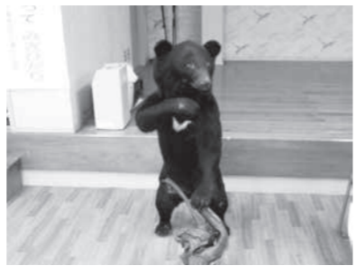
注目を集めたクマのはく製

今回は例年以上に力作が展示され、中でも、「ツキノワグマ」の展示がひととき目を引いていました。来年は、新しい生活スタイルも考えた文化祭が開催できればと願っています。