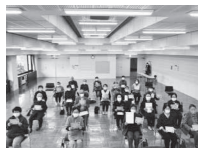
マスクを着用しての講座実施でした

◇クリスマスリース作り クリスマスにむけて、木の実に作った本格的なリースを作ってみませんか。 期 日 12月6日(日) 午前9時～11時30分 場 所 飯山市公民館