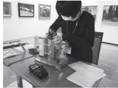
毛髪式温湿度記録計の用紙交換