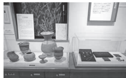
小泉遺跡をクローズアップした弥生時代の展示

皆さんにご覧いただきやすいように、展示品の模様替えをいたしました。お立ち寄りの際はぜひご覧ください。