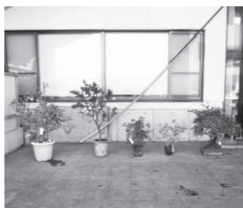
地区盆栽グループの展示

来場者にはコロナ対策を行って見学してもらいました。来年はフルコースの文化祭ができればいいねと、口々に感想を語りながら見学者が帰宅されました。