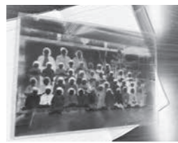
ガラス製写真乾板

10月19日(月)朝8時20分、戸狩地区コミュニティセンターへ編集作業に集まった実行委員会編集委員の皆さんは「10月に入ってからもう8回もやったらさあ」と笑顔をのぞかせます。