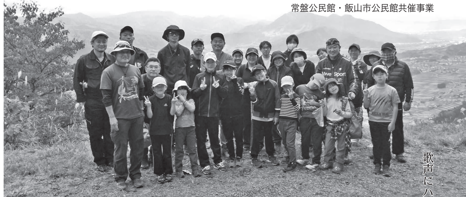
絶景が見渡せる頂上付近で記念撮影