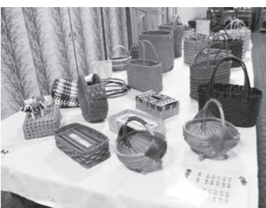
日頃の努力の成果が見て取れる作品の数々