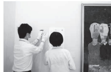
作家の略歴パネルの掲示作業

開館前の館内清掃やガラス拭き、展示室と収蔵庫内の整理整頓や環境整備、市民ギャラリーの展示作品の準備や展示作業など裏方の仕事や、来館者に発券と館内の案内をする受付業務を行いました。 「美術館の仕事ってどんなだろう?」と疑問に思っただけで、臨んだ職場体験を通して、イメージしていたものとは違う面もたくさんあったかと思いますが、美術館の役割、作品を維持保管していくための努力や作業、