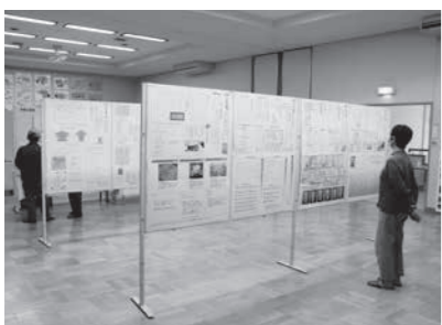
規模を縮小しての展示

◇瑞穂地区文化祭開催 10月25日(日)～11月1日(日)にかけて瑞穂活性化センターで開催しました。今年度は新型コロナウイルス感染防止のため2階大広間の学童、園児や一般の方々作品展示のみ1週間にわたり展示しました。