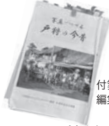
付箋の多さが編集作業の苦勞を物語る編集中の原稿(264ページで発刊予定)

10月19日(月)朝8時20分、戸狩地区コミュニティセンターへ編集作業に集まった実行委員会編集委員の皆さんは「10月に入ってからもう8回もやったらさあ」と笑顔をのぞかせます。