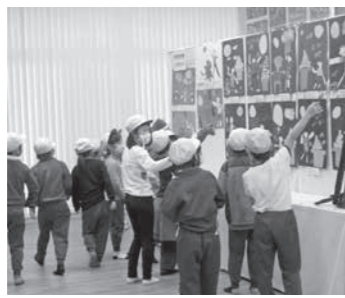
予想を超える来場者数でした

◇秋津地区文化祭開催 10月18日(日)～24日(土)の7日間、今年はコロナ禍とのこともあり趣味の作品展のみの開催でしたが、保育園児、小学校の児童・生徒、地区内外から多くの作品を出品していただき、予想を超える、延べ200人超の皆さんに来場いただきました。