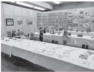
長期間の展示で多くの方が観覧

◇木島地区文化祭開催 第57回木島地区文化祭が、10月18日(日)～24日(土)開催されました。今年度の文化祭は、新型コロナウイルス感染拡大防止のため、地区二周駅伝をはじめとするイベントは中止とし、美術展のみの開催となりました。