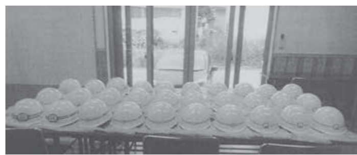
↑今までに助成を受けた各地区で購入された防災物品

安心・安全なまちづくり活動支援公募配分 まちの防災・防犯のために この支援金は、赤い羽根共同募金を財源に、「安心・安全なまちづくり支援」をテーマに地域の皆さんの防災・防犯意識の高まりと助け合いのネットワーク作りを資金面から支援することを目的として、長野県共同募金会から配分されるものです。