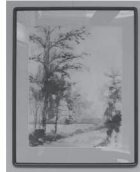
素晴らしい作品が展示されましたので、是非ご覧ください。