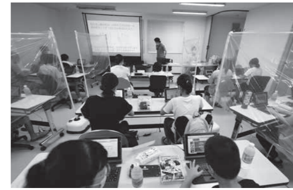
8月8日に開催の親子プログラミング教室の様子

【問】「公民連携推進事業」マウスコンピュータとの包括連携協定の締結について、これから教育関係にもかなり重要なことになると思っています。詳細について説明をお願いします。 【答】連携事項10項目について包括連携協定を締結。その中でもICT教育振興は、現在小中学校に配