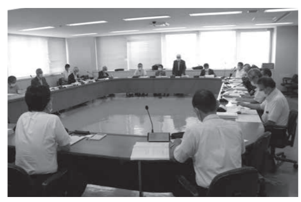
予算決算常任委員会の審査の様子

常任委員会議案審査 委員からの主な質問および意見と市からの説明について抜粋して掲載します。