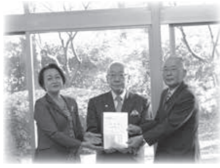
県議会正副議長へ陳情書を手渡しました (左) 清水県副議長、(中央) 宮本県議長、 (右) 渋川会長

(構成) 飯山市・信濃町・山ノ内町・小谷村・長野市・栄村・白馬村・高山村・木島平村・野沢温泉村