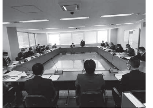
予算決算常任委員会審査の様子