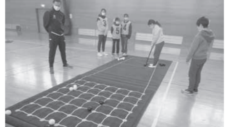
福祉体験教室「わくワクとど塾」(共同募金配分事業)でのニュースポーツ体験

才様のご助力を得て、各店より売上げの一部をご寄付いただきました。 今年度も新型コロナウイルス感染症が日常生活に多大な影響をもたらしている中での赤い羽根共同募金運動でありましたが、市民の皆さまから変わらぬご支援とご協力を賜りましたことに厚く御礼申し上げます。 皆さまより頂戴した募金は、令和4年度の飯山市の福祉の充実、推進を目的とした事業に配分され、見守りほのぼの弁当サービスや福祉教育の推進、ボラン