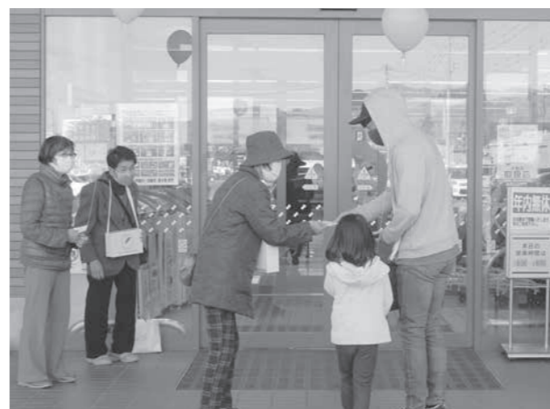
ツルヤ飯山店での街頭募金

10月1日から12月31日まで「赤い羽根共同募金運動」が全国一斉に行われました。商店・企業・学校をはじめ大勢の市民の皆さまからあたたかいご寄付をいただき、総額633万4834円の募金が集まりました。ご協力に感謝申し上げます。