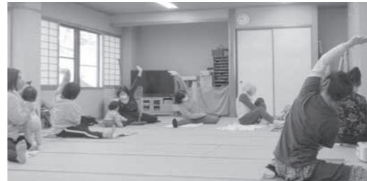
共同募金で助成をしている「秋津地区子育てサロンにここアキッズ」でのヨガ体験

また、赤い羽根共同募金運動の一環として実施している「地域をよくする寄付つき商品」では、例年ご協力いただいていた本町商店街協同組合、飯山カードサービス事業協同組合に加え、今年度より新たにスポーツBARフィ