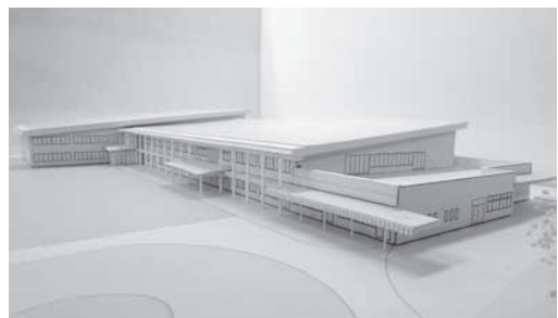
今年度の実施設計を経て来年度から建設工事が始まる城北中学校区新統合小学校イメージ（基本設計段階の模型）

たびかさなる新型コロナウイルスの感染拡大は、家庭及び地域として学校生活の中で多くの不自由を強いる一方で、大変な状況にも対応するため新たな知恵や工夫も生まれてきており、時代の要請・社会の変化に応じた教育行政がますます求められております。 取り組みの重点 飯山市教育委員会の最も大事な事業は、令和7年の開校を目指す「城北中学校区新統合小学校」の建設です。今年度