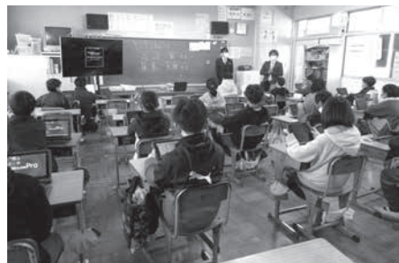
タブレットを使った授業。家庭に端末を持ち帰ってオンラインで課題を提出する取り組みも増えている。

設置される各種検討委員会の方々をはじめ、四つの各小学校の地域の方々、保護者・教職員の方々のご意見やご協力のもと、安心・安全で一人一人の子どもが瞳を輝かせて学び、未来社会を生き抜く力を育む学校づくりを目指し、実施設計業務を進めてまいります。 昨年度から、学校では学力向上、ICT教育や英語教育の充実、そして地域と共に学ぶふるさと学習の推進を重点に取り組んできております。どの重点も、コロナ禍後に訪れる社会を生き抜くために必要な能力や資質を養うもので、本年度もさらに強化して取り組んでいきます。 特に学力向上は、不登校対策とともに各学校で目指している教育の成果として表れるものです。これをベースとし