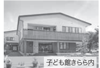
子ども館きらら内 住所: 飯山市大字飯山 2363 電話番号: (0269) 67-0167 (飯山児童クラブ)

Q. 皆さんへ一言お願いします! A. 小さい子向けのおもちゃの広場や人形劇、将棋教室や工作等、行事が盛りだくさんです!お友達や親子で、ぜひ遊びに来てください!