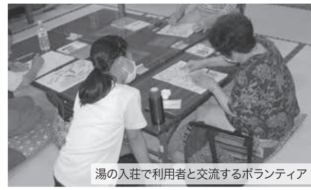
湯の入荘で利用者と交流するボランティア

北都子育て支援センターや児童クラブなどでは、「将来は保育士になりたい」「子どもが好きだから参加した」「自分も利用者だったときに遊んでもらったことがある」、そんなボランティアの学生さんたちと乳幼児や小学生が、笑顔で触れ合う場面がたくさん見られました。 老人福祉センター湯の入荘でも利用者さんと楽しくお話したり、積極的に職員のお手伝いをしたりする姿がありました。 実際に福祉の施設に行き、どのような場所であるのかを学ぶと同時に「自分