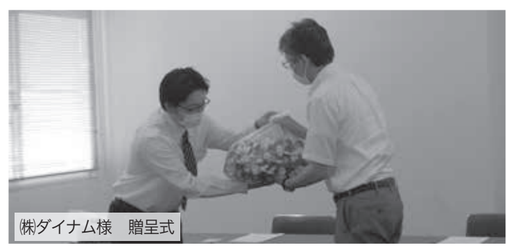
(株)ダイナム様 贈呈式

7月6日株式会社ダイナム様より、ペットボトルキャップとプルタブを、また、26日には道の駅「花の駅 千曲川」様より、ペットボトルキャップをご提供いただきました。収集にご協力いただいた皆さま、ありがとうございました。 お寄せいただいたキャップは、生活に困窮している方やひきこもり等の状態である方にキャップの分別作業をしてもらうことで、緊急的な経済支援や就労の