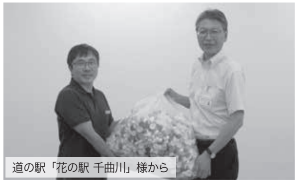
道の駅「花の駅 千曲川」様から

きっかけづくりをして活用しています。 また、分別したキャップは、収集業者に送られ、再生プラスチックとしてリサイクルされる他、換金された収益がエコキャップ推進協会を通じて、医療支援や障害者支援等、様々な社会貢献活動の費用として役立てられます。飯山社会福祉協議会では、随時キャップの回収しておりますので、是非お持ちください。