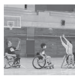
7月の車いすバスケットボール体験

福祉体験教室「☆わくわくとど塾☆」を今年も開催しています。新型コロナウイルスの影響を考慮し、感染症対策を徹底しながら行っています。障がい者や高齢者の皆さんとのふれあい活動等、いろいろな福祉体験ができるメニューを準備しています。地域の魅力を知りながら、