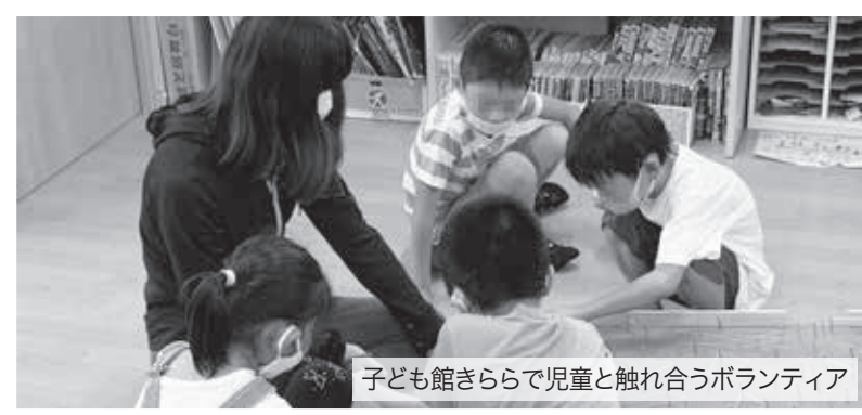
子ども館きららで児童と触れ合うボランティア

「ボランティア活動に関心はあるけれど、参加のきっかけがつかめない」「福祉施設ではどんなことをするのだろうか?」、そんな方々のために、飯山社会協では7月下旬から8月にかけて、