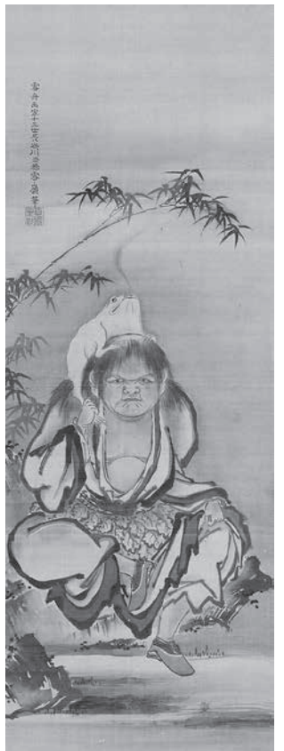
「蝦蟇仙人図」長谷川雪嶺 個人蔵 上の方無料