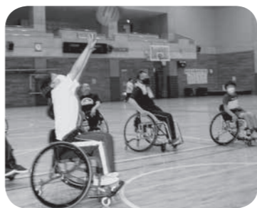
【わくワクとうど塾】車いすバスケットを体験する様子

他にも、街頭募金活動では福祉体験教室「わくワクとうど塾」参加者の子どもたちや市内でボランティア等の活動を行っている諸団体の皆さまと一緒にスーパーマーケット等で呼びかけを行いました。また、各協力店より売上げの一部をご寄付いただく「地域をよくする寄付つき商品」では本町商店街協同組合、飯山カードサービス事業協同組合、ほか2店舗のご助力を得て実施することができました。