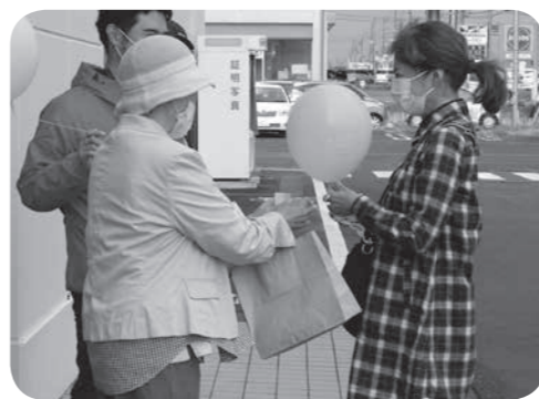
【街頭募金】募金くださった方に風船を渡す様子

今年度も10月1日から12月31日まで「赤い羽根共同募金運動」が全国一斉に行われました。商店・企業・学校をはじめ大勢の市民の皆さまからのあたたかいご寄付により総額557万3665円の募金が集まり、令和4年度飯山市目標額に到達したことをご報告するとともに、ご協力くださった市民の皆さまに深く感謝申し上げます。