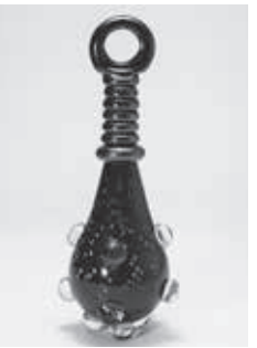
オニカナボウ / 磯谷晴弘 / 1993年