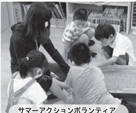
サマーアクションボランティア

「ボランティア活動に関心はあるけれど、参加のきっかけがつかめない」、「ボランティアってどんな事するんだろ?」という方々のために夏休み期間中に参加できる福祉体験を行っています(上写真)