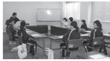
小中高生が手話体験をする様子