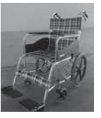
貸出可能な車いす