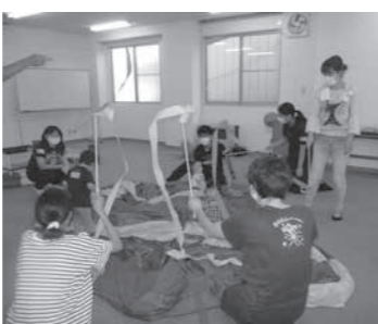
親子でリボンを使って遊ぶ様子

母子通園三園交流会 出張スポーツ教室 親子が笑顔で交流 須坂市・中野市・飯山市の母子通園施設が集まり、今年度3回目となる交流会を実施しました。 今回は飯山市福祉センターでサンアップルの指導員による出張スポーツ教室を行いました。0歳～4歳の登録児童の皆さんが参加され、親子でふれあい遊びから始まり、全身を使った遊び、最後のバルーンでは、力を合わせ