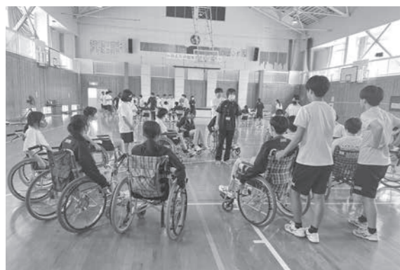
生徒たちが車いすの操作方法を教わる様子

福祉教育を取り入れませんか 城北中学校3年生が 福祉体験 9月8日に、飯山市立城北中学校の3年生を対象に、長野社会ふくし専門学校より講師をお招きし、高齢者疑似体験および車いす体験を行いました。 生徒たちは、白杖とアイマスクを使用し、二人一組でステイジを移動する体験や、車いすの操作方法・介助の仕方等を学びました。体験を通して、加齢や障がいへの理解を深めました。 福祉教育出前講座を希望される方は、当協議会までお問合せください。