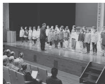
小学生による平和への賛歌

☑ その他 重量10.5kgの軽量タイプ 折り畳みがコンパクト 空気漏れのないノーパンクタイヤ