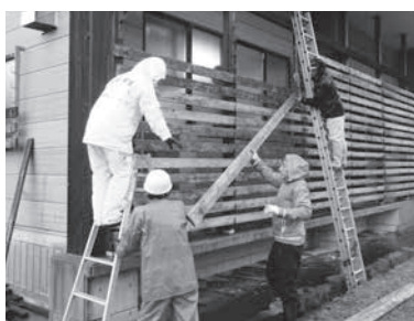
雨の中、協力して行いました