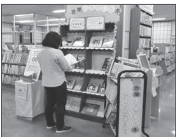
▲お手に取ってご覧ください

今年ご寄贈いただいた絵本の特設コーナーを2階閲覧室に設け、貸出ができるようになっていきます。ご寄贈いただいた本のうち、準備が整ったものから随時貸出を行っていきます。今まで図書館になかった絵本が増えていきますので、ぜひご利用ください。