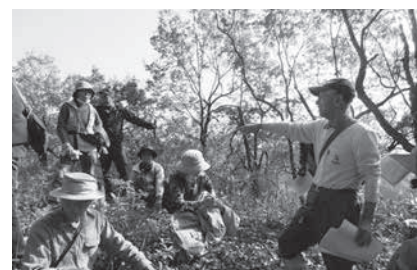
紅葉の中城跡をめぐりました

参加者は、色とりどりの紅葉に囲まれた城跡に立ちながら、木々の少なかった時代の風景に思いをはせていました。