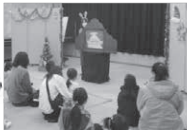
▲コックさんの顔が、むにゅ むにゅ むにゅ!

12月3日に、クリスマスおはなし会が開催されました。皆さん楽しみにしてくれていた様子で、大勢のお子さんとご家族の方が遊びに来てくださいました。どんなおはなしが聞けるかな?