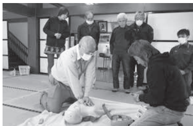
AED講習会 皆、真剣です

11月19日、富倉公民館で、集落館長・専門部員、区長、社協役員で避難訓練を実施しました。14時頃、調理