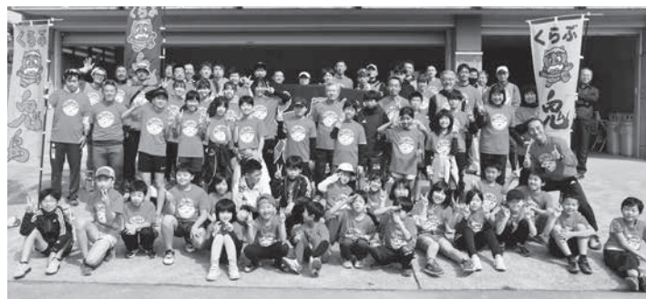
木島駅伝チームの皆さんと

子どもたちの盛り上がりや地域の活性化にも繋がると思っていますので、今回の駅伝練習に参加したことにより子どもたちが他の公民館事業、地区の行事などにも参加して木島地区が盛り上がりつつあればと思います。