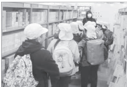
▲いろいろな本があるなあ

11月17日に常盤小学校2年生、21日に戸狩小学校の2年生と3年生が、図書館見学に来てくれました。司書が図書館について説明したり、図書館のさまざまな場所を案内したりしました。