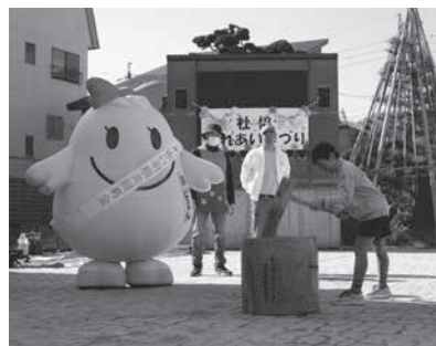
チャリティ餅つきの様子(ふれあいまつり)

昨年10月1日から12月31日まで「赤い羽根共同募金運動」が全国一斉に行われ、飯山市の共同募金運動では区、学校、職場、企業、商店等に広く協力