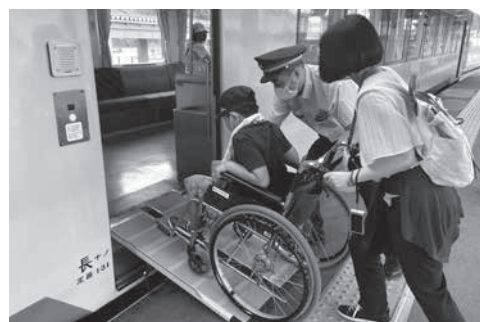
福祉体験教室 車いすで電車に乗る様子

さまからの赤い羽根共同募金に対する格別のご理解とご支援によるものであります。今後、誰もが孤立することなく、自分らしく安心して暮らすことができる福祉のまちづくりに努めてまいりますので、皆さまの変わらぬご支援とご協力の程よろしくお願いたします。