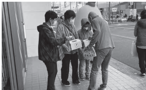
募金活動をするボランティア(ツタヤ)

を実施するにあたり区長・民生委員等の地区役員の方々、募金箱の設置協力や募金の呼びかけ活動の場所を提供くださった施設・商店、また「地域をよくする寄付つき商品プ