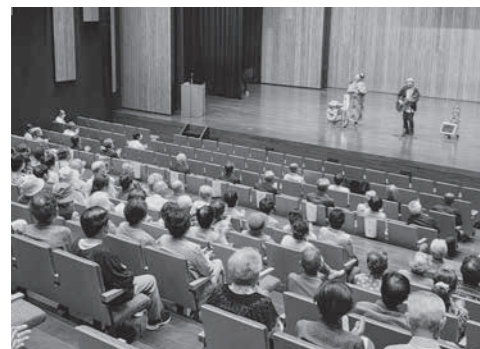
飯山地区社会福祉協議会 敬老会

昭和の時代を生き、未来へと続く日本の発展にご尽力いただいた75歳以上の方へ感謝とお祝いの気持ちを込めて敬老会を開催しました。