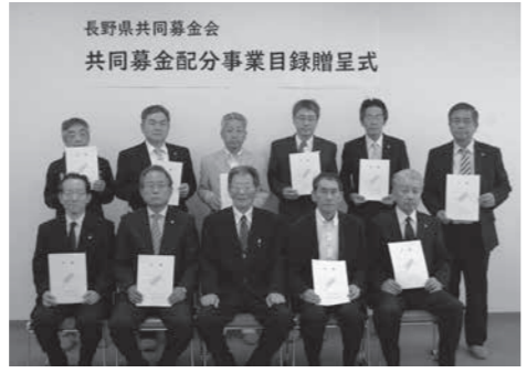
長野県共同募金会 共同募金配分事業目録贈呈式

築や住民の自治力の形成をはじめとした地域福祉の裾野を広げる活動を資金面から支援することを目的として、長野県共同募金会から配分されるものです。 配分が決定された10団体は左記の通りです。発電機や投光器等、いずれも災害に対応した備品の整備に配分金を活用する予定です。