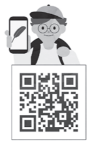
↑インターネットで募金される方はこちらから

募金活動は各世帯を対象とした戸別募金、企業や官公庁等の職員を対象とした職域募金、施設や店舗等を対象とした街頭募金などで行われます。今年度の街頭募金箱の設置については次の施設・店舗のご協力を予定しております。 飯山市役所、飯山市公民館、飯山市文化交流館 なちゅら、飯山駅観光交流センター、いいやま湯滝温泉、道の駅「花の駅 千曲川」、なべくら高原森の家、高橋まゆみ人形館、飯山高校、飯山赤十字病院、(株)