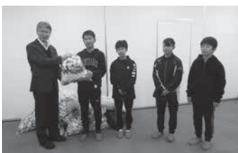
1月31日、木島小学校さまからエコカップを寄付していただいた様子

当協議会では、高齢者や心身障がい者世帯を対象とした見守り活動として、配食サービスとふれあいコールを実施しております。申込、問合せは当協議会まで。