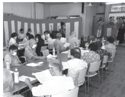
秋津地区社会福祉協議会 敬老会

昭和の時代を生き、未来へと続く日本の発展にご尽力いただいた75歳以上の方へ感謝とお祝いの気持ちを込めて敬老会を開催しました。