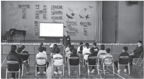
泉台児童クラブ閉所式の様子

令和7年度から市内小学校4校が統合し、新たに城北小学校が開設となりますが、それに伴い、瑞穂・常盤・泉台児童クラブ、戸狩児童センターも新たに「城北児童クラブ」として開所することになり、令和7年3月末にて現在のクラブを閉所することとなりました。 閉所する児童クラブは、家庭と学校と地域の皆さまのご協力をいただきながら、共に児童を見守り子ども