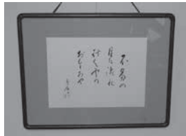
3月～4月の展示団体 飯山市書道協会 さま