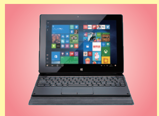
マウスコンピューター 10.1型2in1タブレットPC MT-WN1003-IIYAMA (キーボード標準セット)