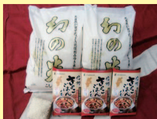
「幻の米10kg」+ 「信州きのこごはんの素」 セット