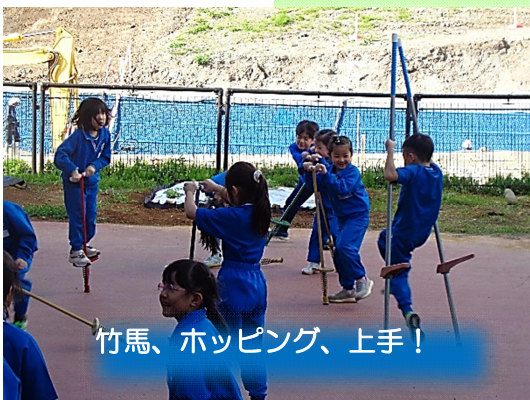
竹馬、ホッピング、上手！

きらら活動が始まりました。4月も後半を迎え、1年生の子どもたちも少しずつ子ども館の生活に慣れてきています。子ども館ですので、遊びが子どもたちを育てていくことを大事に、職員みんなで子どもたちの成長を見守っていきたいと思っています。