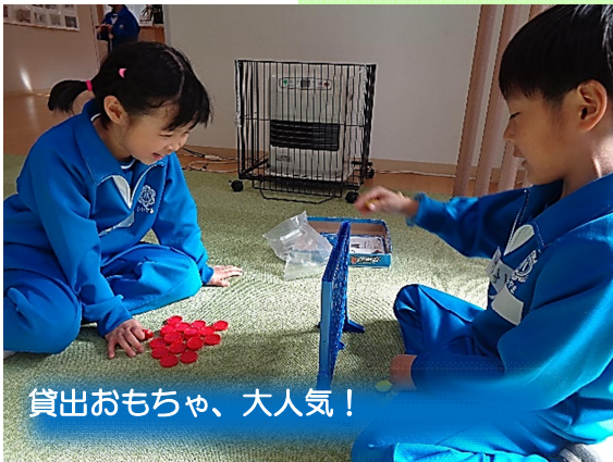
貸出おもちゃ、大人気！