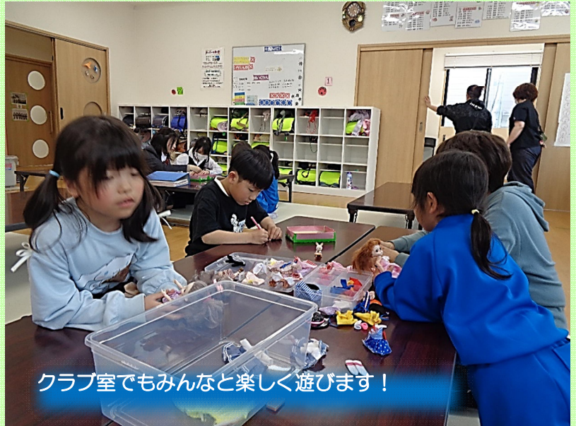
クラブ室でもみんなと楽しく遊びます！

学校から帰ると、体育館に一直線、「ちょっと待って下さい。」と先生に諭される様子も。貸出おもちゃも大人気で、休憩コーナーは子どもたちでいっぱいです。外では一輪車、ホッピングに興じます。何がそんなに楽しいのかと思うくらい大きな1年生の笑い声が館内、館の外に響きます。遊ぶことが大好きな1年生です。