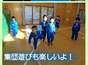
集団遊びも楽しいよ！