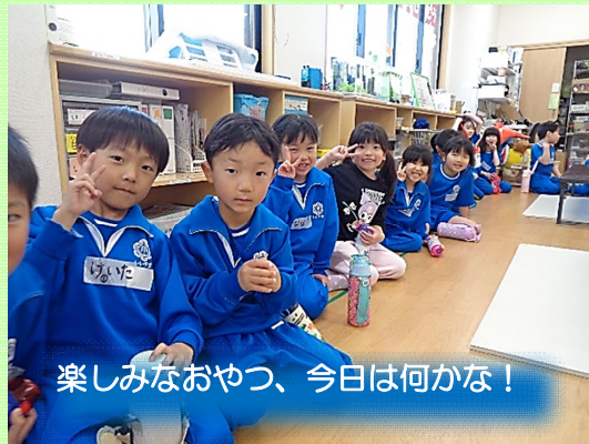
楽しみなおやつ、今日は何かな！