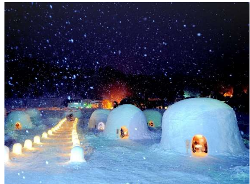
「かまぐらの里」風景