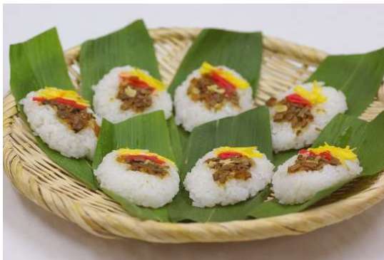
郷土料理の「笹ずし」