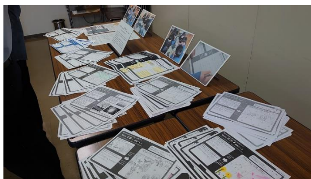
会場では小中学生の「ミライ提案シート」を展示