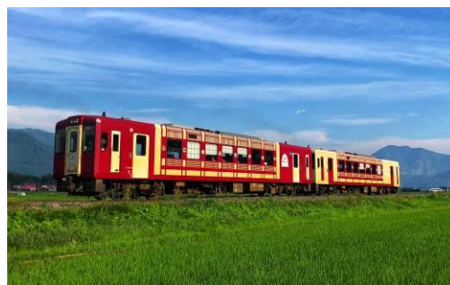
飯山線観光列車「おいこっと」