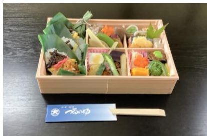
「走る農家レストラン

飯山線ののどかな風景とともに地元の食をお楽しみいただける試みとなりますので、ぜひ一度ご体験ください。