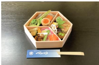
「走る農家レストラン