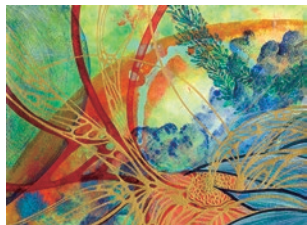
Photosynthesis / 30×40cm, 2021