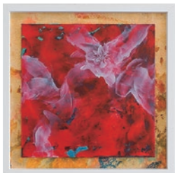
Calmi Cuori Appassionati / 25×25cm, 2021