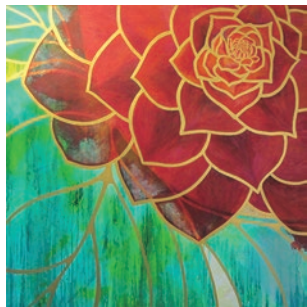
Loving to grow / 110×110cm, 2019

墨絵パフォーマンス: 2017年よりヨーロッパ各地にて即興音楽家とのコラボレーションによる即興墨絵パフォーマンスを展開