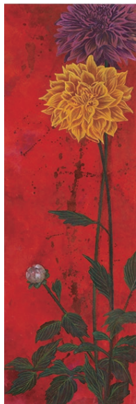
Dahlia / 90×30cm, 2018