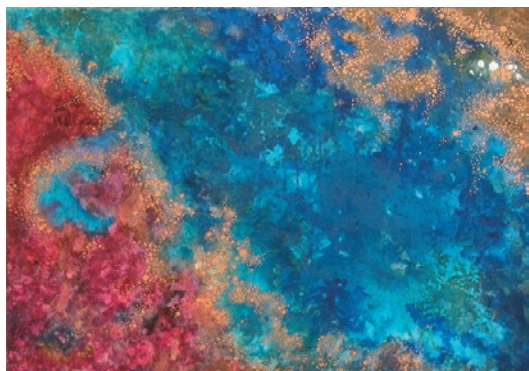
Birth / 70×100cm, 2015