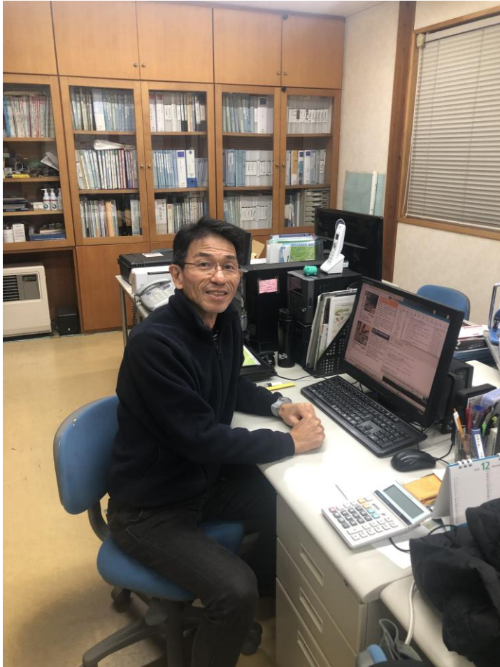
各種業務を担当しています