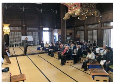
▲R1. 10. 23 勝興寺にてボランティアガイドの説明を聞く