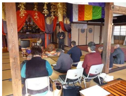
▲R1. 11. 26 永国寺の学習