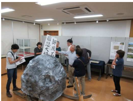
▲善光寺地震から考える展示説明