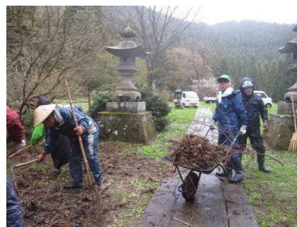
▲H31. 4. 27 大聖院周辺の清掃