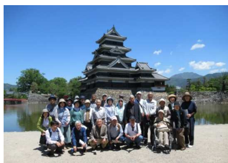
▲H31. 5. 23松本城にて