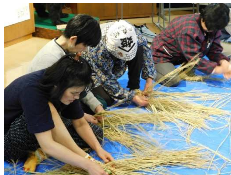
▲わらぐつ作り講習会にて