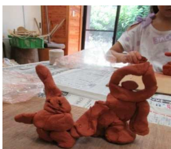
▲土器作り・自分だけの土偶を作る