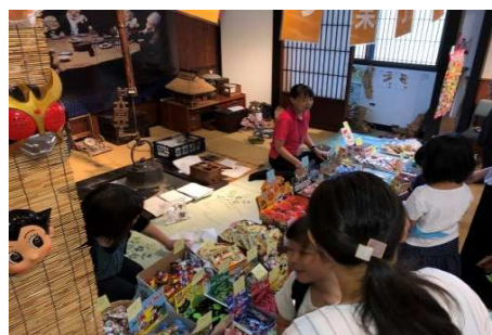
▲毎年人気の“なつ菓子屋”に集まる子どもたち