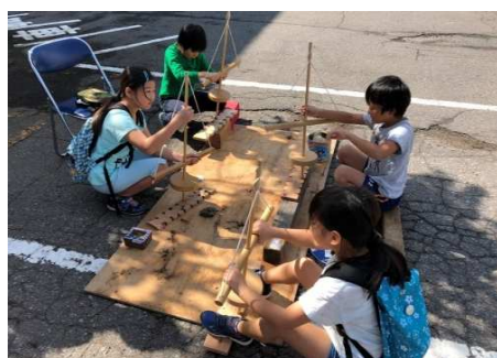
▲火起こし体験、火がついたかな？