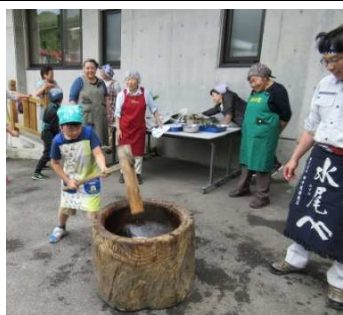
▲笹もちづくり、餅つきから