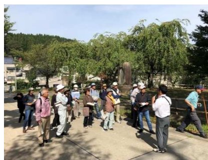
▲R1. 9. 20 飯山城現地学習会