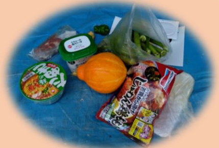
実際にごみとして出されていた食料品

コンポスト等を使った堆肥化の実践や、水切りの徹底のほか、食材の買いすぎや料理の作りすぎに注意し、食品ロスとならないようにしましょう。