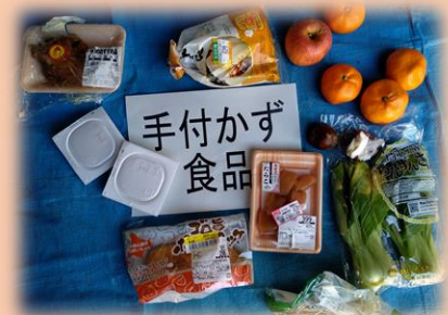
実際にごみとして出されていた食料品

コンポスト等を使った堆肥化の実践や、水切りの徹底のほか、食材の買いすぎや料理の作りすぎに注意し、食品ロスとならないようにしましょう。