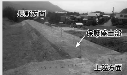
△上倉地区内の西回り線付近トンネル盛土工事状況…保護盛土で覆う形で軌道敷を建設。下方の西回り線坑口から飯山トンネルへ通じる。現地は、左の地図上でAと表示された場所。「→」は撮影方向。

来年度の工事としては、主に上倉区側の明かり部分の工事に着手します。工事区間は、飯山市側のトンネル坑口から長峰トンネルまでの間の延長約420