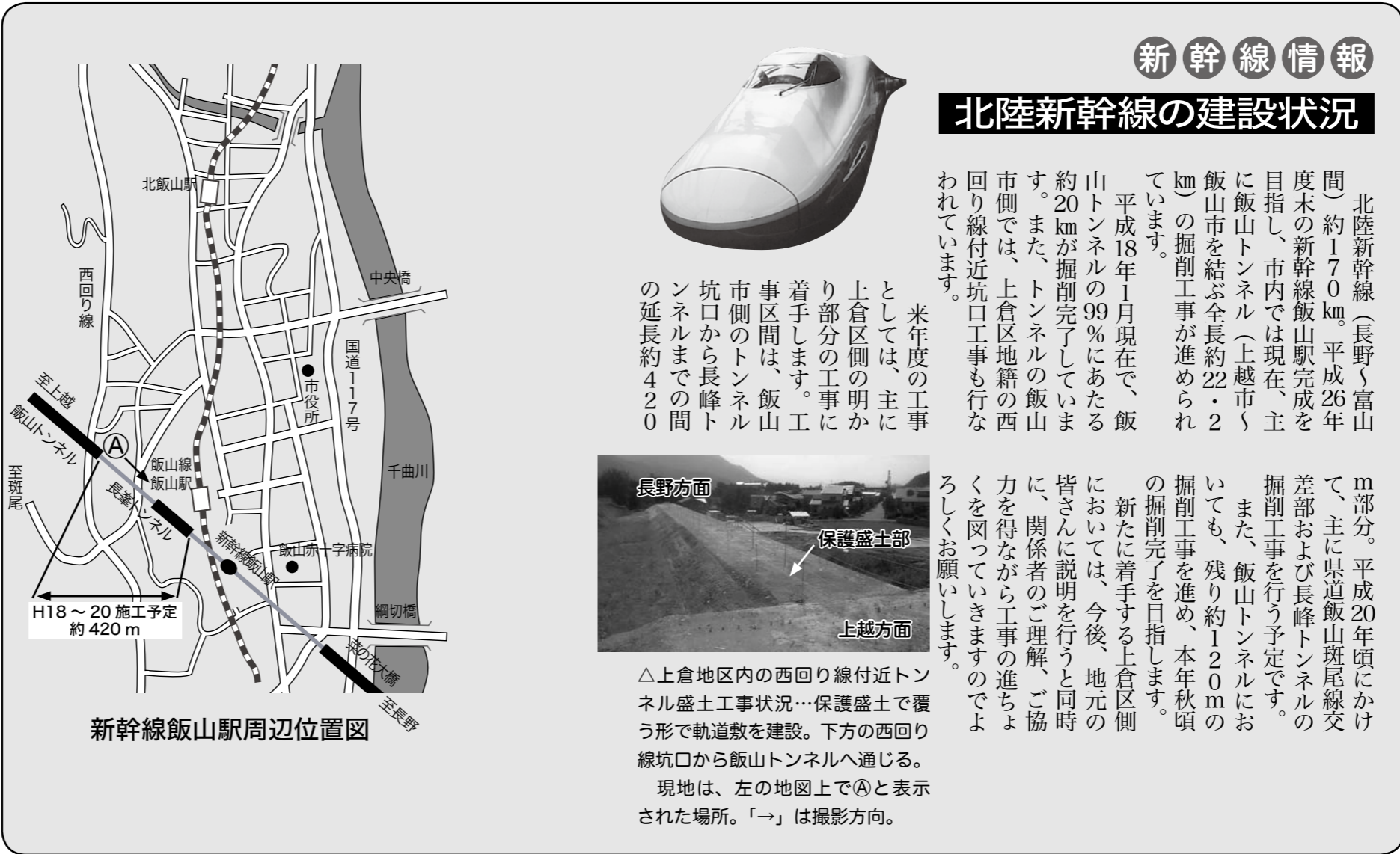
新幹線飯山駅周辺位置図