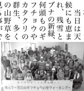
地元学く黒岩山ギフチョウの里ウォーキング

外様 5月21日(日)実施を 地元学く黒岩山ギフチョウの里ウォーキング 当日は天候にも恵まれ、残雪とブナの新緑、何頭ものギフチョウやカタクリの群生、多くの山野草を見ることができました。地元学では、見てきた事、感じた事などを、地図や絵に書いて発表し合いました。80名の参加者からは「楽しい言葉を送りました」と、沢山の嬉し