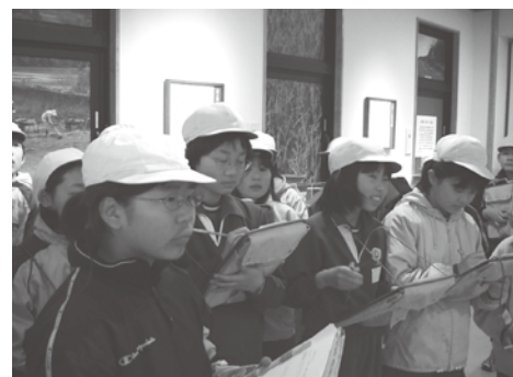
△熱心にメモする飯山小の児童たち

みたり、飯山を代表する動物の「カモシカ」や同じく代表する植物の「ブナ」のジオラマ、文化や自然などがミニチュアで再現されている標本箱な等から、視覚的に「ふるさと飯山」を学習していきます。