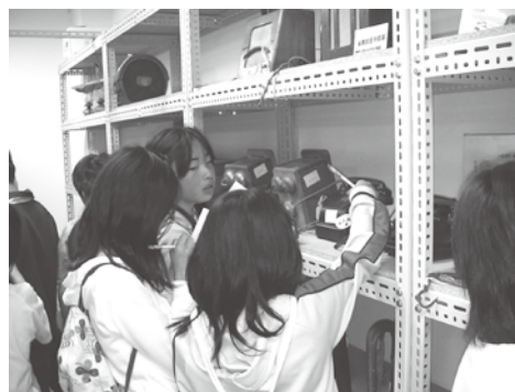
△昔の電話を調べる東小の児童たち

ふるさと館では、市内小中学生を対象として、見学を含めた体験教室を行っています。 社会科で歴史の勉強をしている6年生では、縄文土器の文様を粘土に付けたら、実際に飯山で発掘された石器に触れたり、学芸員から土器の特徴などを聞いたりし、学校で勉強している教科書を越えた、「ふるさと学習」を行っています。