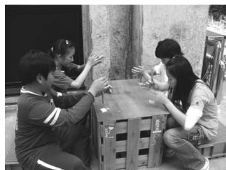
△ふるさと館クラブ活動の様子

次に、火おこしをやりました。教えてもらう前はそんなに力があるものとは思いませんでした。木と木をすってまさつを起こし、黒い粉に息を吹きかけ、赤つぽくなつたら麻にうつせば火がつきます。力をいっぱいだ