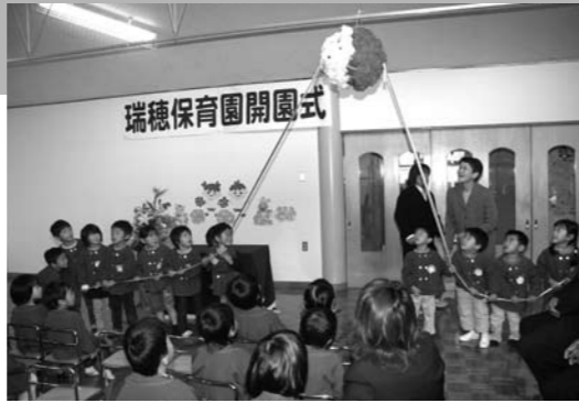
△旧瑞穂保育園と、旧南瑞穂保育園が統合した新「瑞穂保育園」が10月2日に開園。園児や保護者、地元関係者らが出席した開園式では、園児によりくす玉が割られ新たなスタートを祝いました。