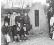
ふれあいバスハイク

◆ふれあいバスハイク 11月26日(日)地区子ども会育成会と共催で、バスハイクを行いました。当日は15名の参加があり、今回は安曇野方面をまわり、ちひろ美術館、アートヒルズ・ミュージアム、大王わさび農場などを散策したりと、楽しい1日を過ごしました。参加者からは「すごく楽しかった。」と嬉しい言葉もいただきました。