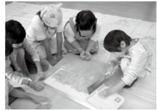
秋津 秋津地区活性化

◆岡山 11月23日22人の子どもが集まり、そば打ちを行いました。「コネ」がうまく出来ず「そば」と「小麦粉」の塊を作った班もありました。が、おおむね良好。お昼に合わせておいしくいただきました。 ◆力作勢揃い！ 11月19日、趣味の作品展が活性化センターで開催されました。今年は、58名137作品が寄せられ、市議選の投票に会場された方々目を惹き寄せました。