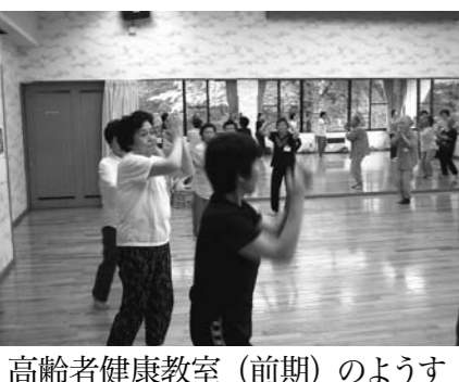
高齢者健康教室 (前期) のようす

・ 申込締切 9 月 25 日 (火) ・ 申し込み先 飯山市教育委員会事務局 スポーツ生涯学習課 スポーツ振興係 電話 62-3111 内線 353・354 電話での申し込み可能。