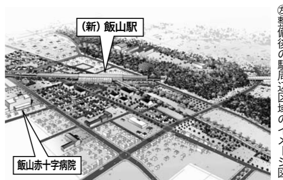
整備後の駅周辺区域のイメージ図