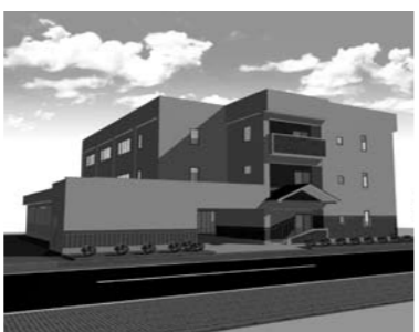
△完成後のイメージ図

旧団地の跡地に建設される新しい団地は、鉄筋コンクリート造3階建てで、延床面積は1360.9㎡。入居戸数は12戸で、総事業費は2億2800万円です。 新幹線飯山駅の近くに建設される新しい団地の完成