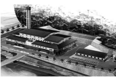
△新しいクリーンセンターの完成後イメージ図

われてきた掘削作業も、今回の貫通により長野県側はすべて貫通し、全体でも新潟県側の入口にあたる板倉工区(上越市)の約37メートルを残すのみとなりました。 平成26年度末までの長野・金沢間の開業を目指す北陸新幹線。飯山市内では約10キロメートルが新幹線の走る経路となっています。現在、市内では飯山地区の上倉地籍において、県道飯山斑尾新井線をまたぐ橋りょう、および線路を覆うスノーシェルターの工事が行われており、来年の完成を目指し着々と工事が進められています。