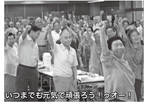
いつまでも元気で頑張ろう！ウオー！

飯山地区敬老会開催 9月17日(敬老の日) 飯山小学校ランチルームにて多くのご参加をいただき実施しました。