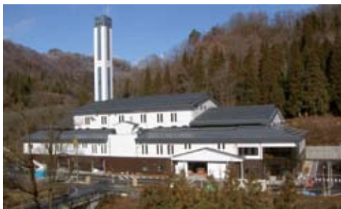
■エコパーク寒川 飯山市大字照岡 2600 - 1 ☎ 69 - 1085

「エコなくらし」へのご意見をお寄せください 市民環境課生活環境係 ☎ 62 - 3111 内線 192