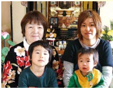
飯山地区 3歳4か月 No. 275