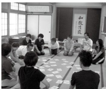
△瑞穂針田区学習会の様子

昨年度（H21）の市民への意識調査に見られるように仕事と家庭生活の両立に関する調査において、男性の育児休業取得に賛成する意見が半数以上になっており、出産後の女性が職場復帰することに賛成するが85%にもなっています。しかし、制度が整備されつつあっても現実に育児休業等の取得が困難だったり、社会通念などから男性の育児休業取得が少ないのが実情です。その結果、女性への負担が増しているのが現状のようです。負担を軽減するための